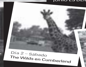
Día 2 - Sábado The Wilds en Cumberland