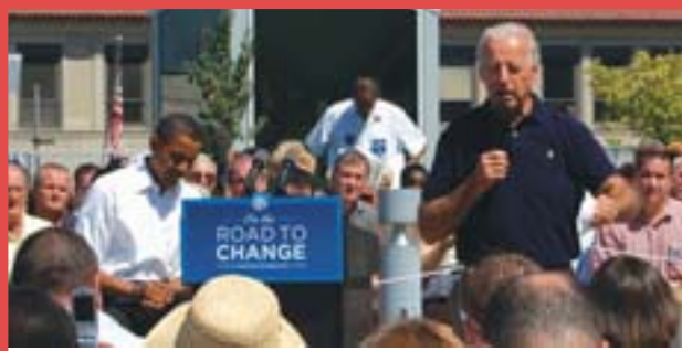
On August 31, 2008, Obama traveled to Toledo Sunday afternoon for an economic forum at the main branch of the Toledo-Lucas County Library.

Special Edition of La Prensa for Lazo Cultural